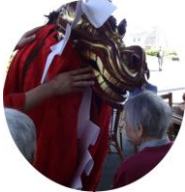
五月十二日、稲葉神社例祭にて、獅子舞が来館。太鼓や笛の音に誘われ、玄関に出ると、麒麟獅子が現れました。皆様は獅子の舞に目を奪われ、無言で見入っておられました。舞が終わると大きな拍手で包まれました。最後に皆様

今年も豊作を期待し、 四月に入り入居者様と共 に土作りを実施し、きゅ うりやトマト、なすの苗 植え、ねぎ、おかひじき 等の種を播きました。皆 様毎日の水やりをしなが ら、収 穫を楽 しみに されて います。